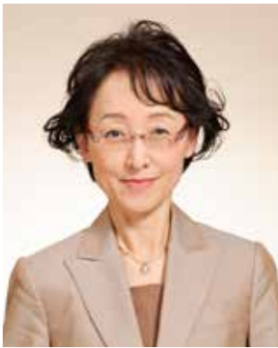
カウンセリングオフィス・ヒロ